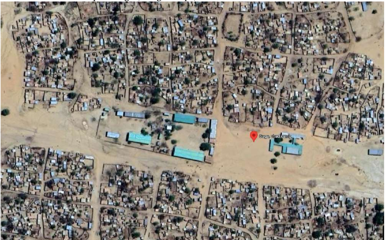
Le centre du camp de Gaga (Tchad)

Il y avait 23 000 habitants dans ce camp en 2013, majoritairement massalites.