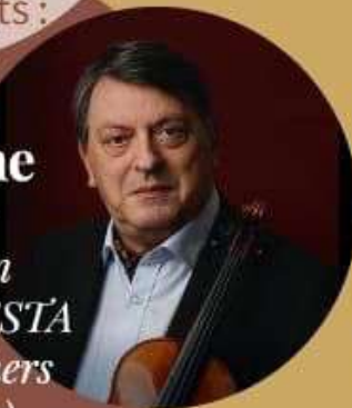
Illustration musicale :

Président de la section française de l'ESTA (String Teachers Association)