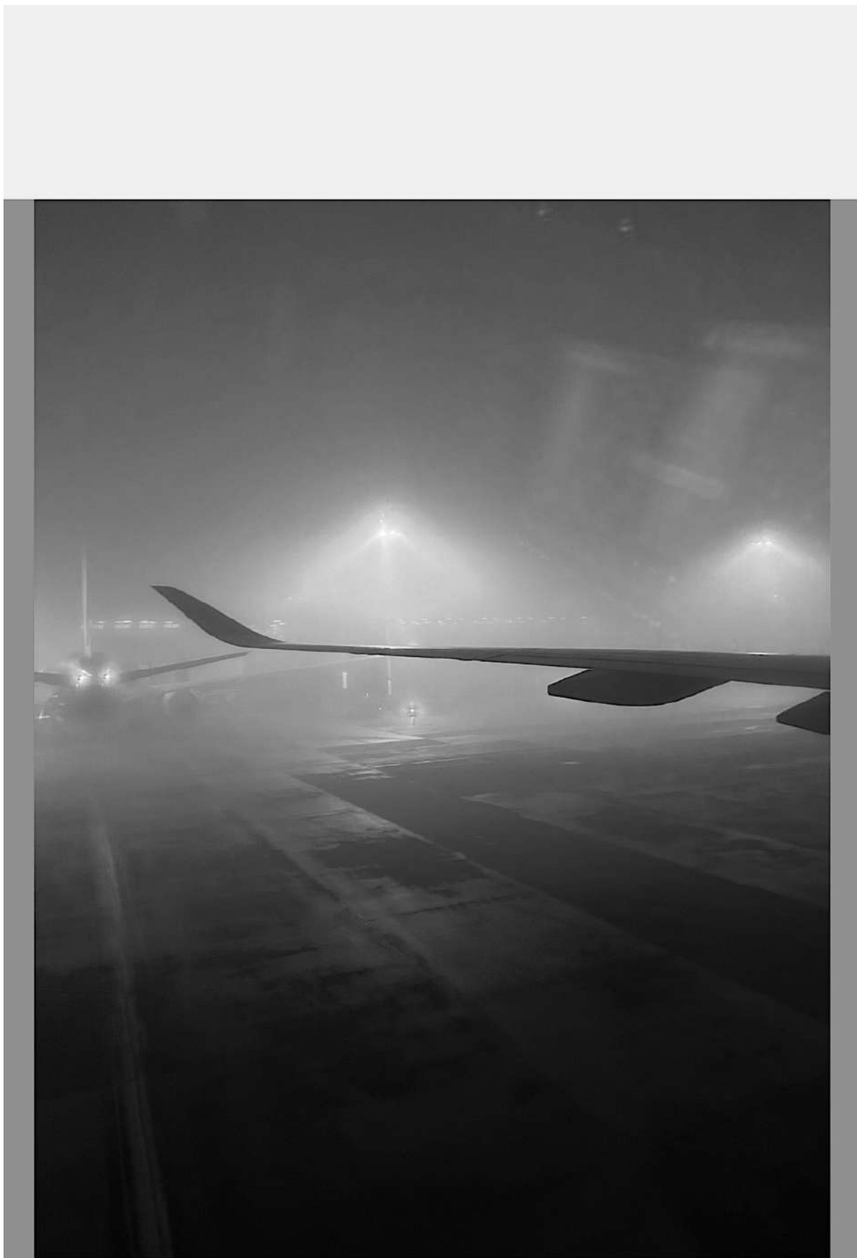
Et oui il faut y passer