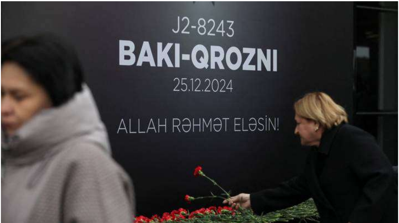
« Des personnes commémorent les victimes de l'accident d'avion d'Azerbaijan Airlines près de la ville kazakhe d'Aktau, sur un mémorial installé à l'extérieur de l'aéroport de Bakou, Azerbaïdjan, 26 décembre 2024 »

Lavrov Claims France Sought Dialogue on Ukraine War Without Kyiv (The Moscow Times) Lavrov fait appel aux poutinistes d'ici. Nous en avons effectivement plein et d'excellents articles pour l'exportation. Et ça remonterait la balance commerciale. Quoique, le rouble recommence à s'effondrer... Il vaut peut-être mieux se les garder en attendant... Tant que le grand Poupou n'arrive pas à remonter sa monnaie... Mais alors, que faire de ces nuisibles en attendant peut-être encore longtemps ??? (JCdM)