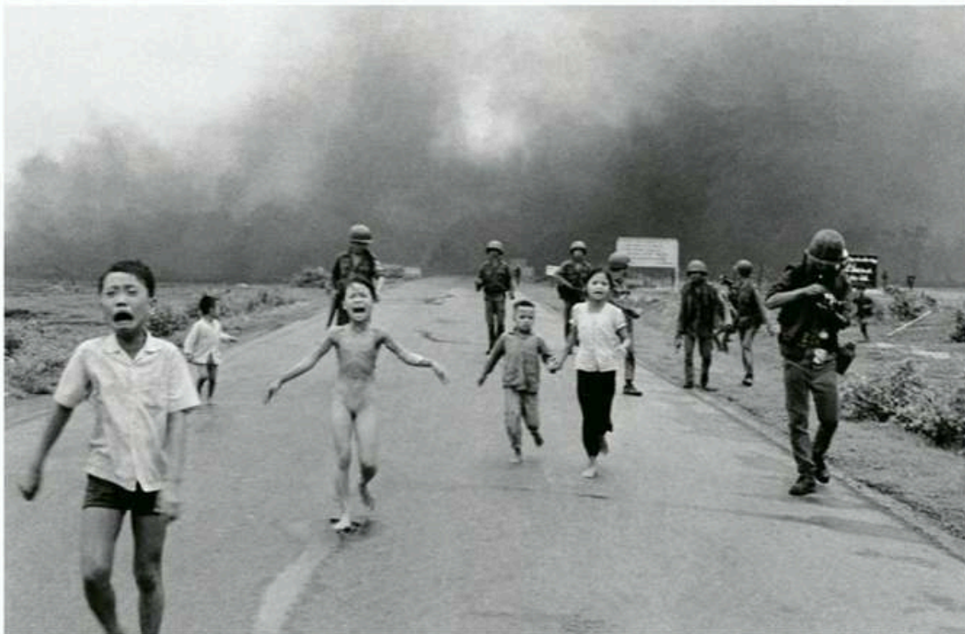
Photographie de Kim Phuc, 9 ans (au centre), fuyant avec d'autres enfants après une attaque au napalm, près de Trang Bang, au Vietnam, le 8 juin 1972.