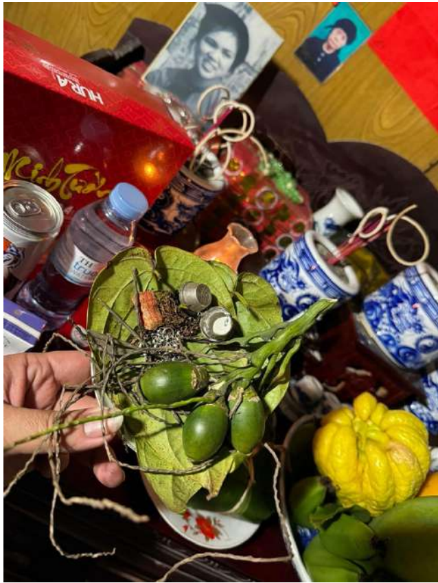
Xuan Bach prépare la chaux pour le Têt