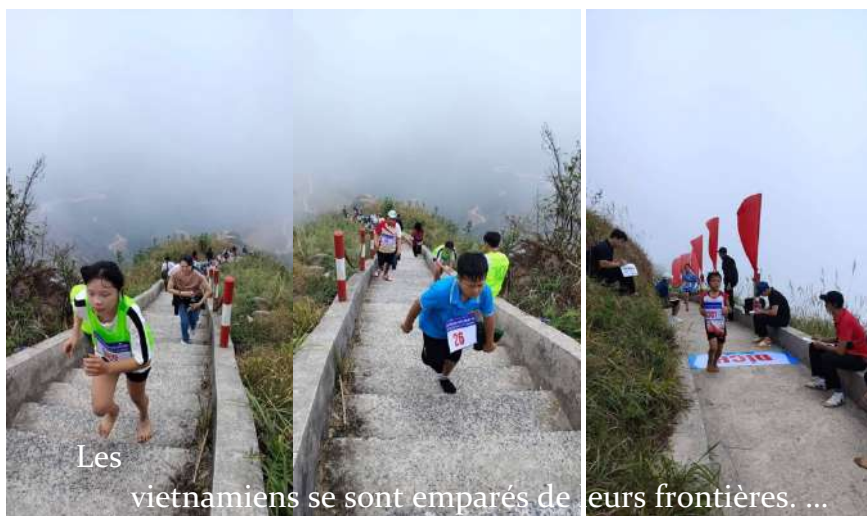
Les vietnamiens se sont emparés de leurs frontières. ...

Aujourd'hui le tourisme vietnamien ENFIN s'empare de son pays DdM