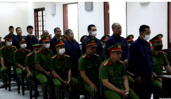
Tổ chức Nhân quyền châu Á chỉ trích Việt Nam bỏ tù 9 nhà sư và nhà hoạt động Khmer Krom

https://www.voatiengviet.com/a/to-chuc-nhan-quyen-chau-a-chi-trich-viet-nam-bo-tu-9-nguoi-khmer-krom/7878846.html?itflags=mailer&utm_content=pg_nl&utm_medium=email&utm_source=B%E1%BA%A3n+tin+VOA+Ti%E1%BA%BFng+Vi%E1%BB%87t+h%E1%BA%Bing+ng%C3%Aoy&utm_campaign=EMAIL_CAMPAIGN_28.11.2024