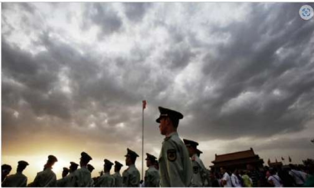
Des policiers paramilitaires patrouillent sur la place Tiananmen à l'extérieur de la Cité interdite, ancien palais impérial depuis le milieu de la dynastie des Ming jusqu'à la fin de la dynastie des Qing, à Pékin le 18 mai 2011.

22 octobre 2024 16:01 Mis à jour: 22 octobre 2024 16:01 Ning Xing a contribué à la rédaction de cet article