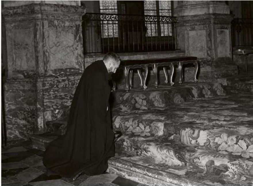
L'abbé Pierre à l'église Saint-Merri, à Paris, en 1956.