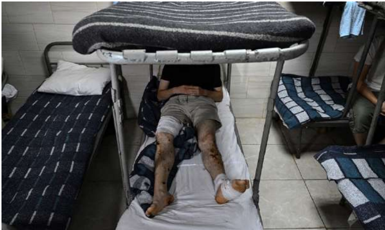
« Russian prisoners of war at a Ukrainian facility at an undisclosed location in the Sumy region. » Les conscrits russes faits prisonniers parlent.

Should the war continue, he said: “It’s without me, guys. I have my family, I have my life, my future. I’m not going to die for these bastards. I don’t owe Russia anything.” »