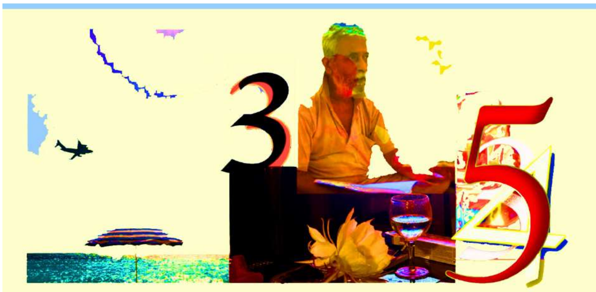
Photo : Centre Pompidou, Agence Photo de la RMN, Exposition "L'ironie à l'œuvre", 2016.

Paul Klee. Angelus Novus. 1920. Technique mixte sur papier. 32 x 24.