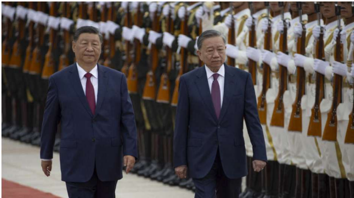
Le président chinois Xi Jinping (G) marche à côté du président vietnamien To Lam alors qu'ils passent devant la garde d'honneur lors d'une cérémonie de bienvenue au Grand Hall du Peuple à Pékin, le 19 août 2024.

sur RFI https://www.rfi.fr/fr/asi-pacifique/20240821-la-chine-annonce-souhaiter-une-r%C3%A9unification-compl%C3%A8te-avec-ta%C3%AFwan-sur-le-mod%C3%A8le-de-hong-kong