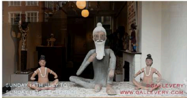
A Summer of Gods and Goddesses

A SUMMER OF GODS AND GODDESSES REVIEW: THE GUARDIAN