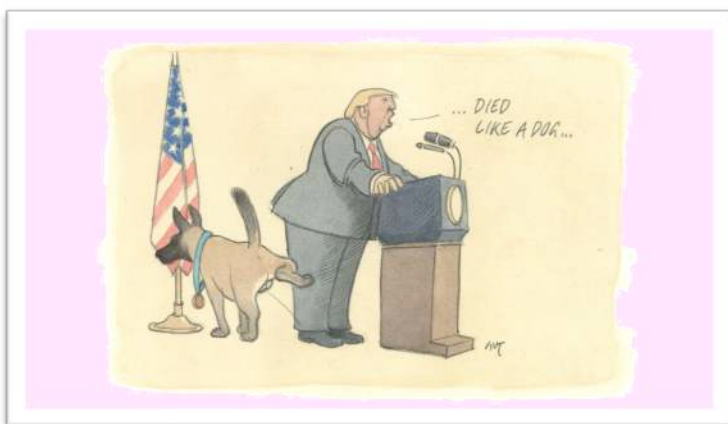
Die Karikatur der Woche (NZZ)