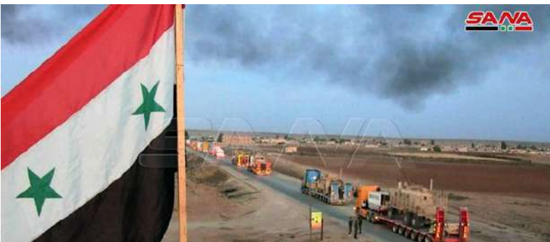
Retrait d'un grand convoi militaire de l'occupation américaine de la Syrie en direction de l'Irak (Photos et Vidéo )

Le jour suivant, des unités de la police militaire russe ont commencé à patrouiller le long de la frontière turco-syrienne. »