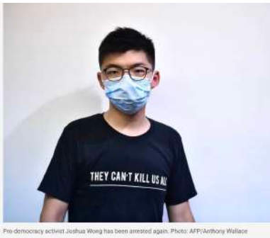
Pro-democracy activist Joshua Wong has been arrested again.

La détention du dissident le plus en vue de la ville est la dernière d'une série d'arrestations de critiques du gouvernement et intervient après que la Chine a imposé une nouvelle loi radicale sur la sécurité nationale à Hong Kong fin juin.