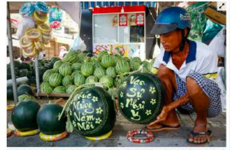
Khách hàng đang phân vân chọn cặp dưa đầu có khắc chữ "Chúc mừng năm mới" hay "An sự như ý" có giá 700.000 đồng. Theo các chủ sạp, dịp Tết này, trung bình mỗi ngày có thể bán 5-10 cặp dưa tươi.