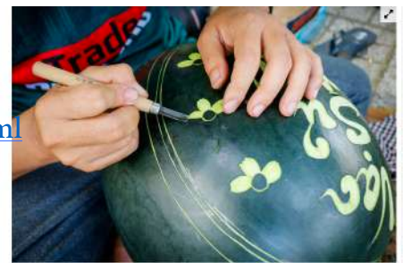
Để khắc một cặp dưa trung bình mất khoảng 30 phút.

https://vnexpress.net/kinh-doanh/dua-khong-lo-chung-tet-4045022.html