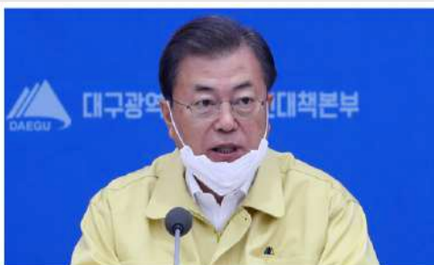
Tổng thống Hàn Quốc Moon Jae-in phát biểu tại thành phố Daegu, tâm dịch Covid-19 hôm 25/2.

Du C ôté Viet N am - toujours avec nos amis