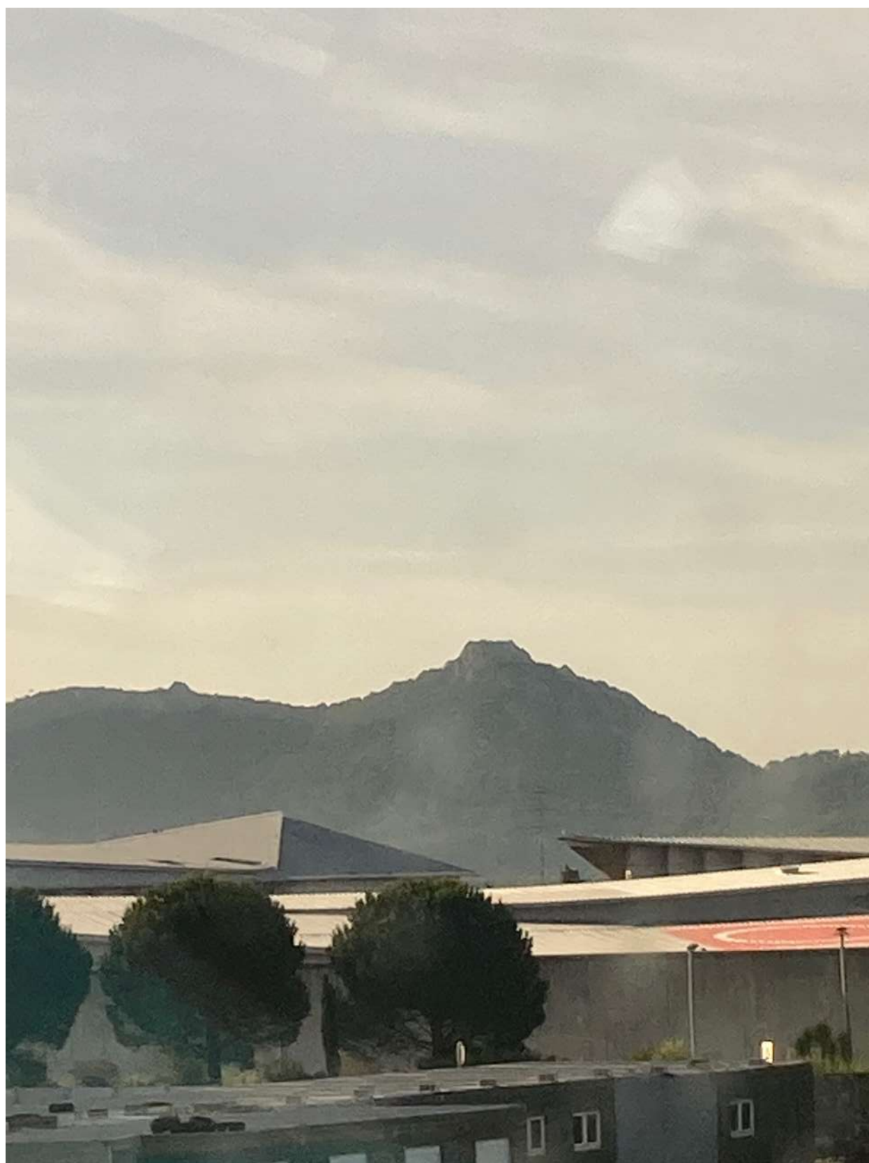
Au fond le Fenouillet